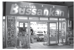
つくば駅構内にある「つくば物産館」

は、つくばサイエンスツアーバスが運行されている。運行は土・日・祝日で、夏休み期間中(7/23~8/31)は特別運行(月曜日を除く)もあり、国土地理院やつくば植物園、つくばエクスプレスのH-IIロケット実物大模型が目に入る。つくば美術館は貸ギャラリーとして個展やグループ展が開催されている。さくら民家園は伝統的な古民家を移築したもの。懐かしさを感じながら、古き良き時代に思いを馳せてみよう。つくばエクスプレスは、最新の科学技術や身近な科学に親しむことのできる施設。世界最大級のプラネタリウムや各種の科学体験は、童心に返って楽しむことができる。