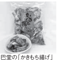
巴堂の「かきもち揚げ」

お土産は赤塚駅北口にある巴堂の「かきもち揚げ」がお薦め。職人の手で丁寧に手揚げした旨味とコクのある人気商品だ。