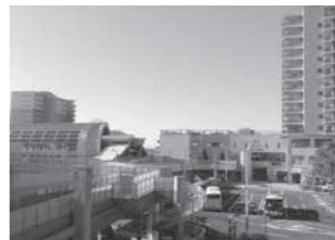
●北口は小さなデッキになっている。

●2面3線のホームを持つ地上駅であるが、駅舎は橋上にある。改札口は一箇所で北口と南口を連絡する自由通路がある。