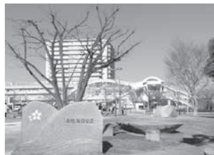
●南口にある赤塚駅前公園。