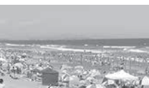
大竹海岸鉾田海水浴場 海開き 7月21日(土)～8月19日(日)

お葉付きイチヨウ ●照明院の阿弥陀堂の前にある樹高は約27m、幹の周りは約6mの銀杏の大木。普通の銀杏とは異なる葉の縁に実がつく。