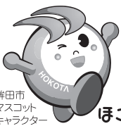
鉾田市マスコットキャラクター ほこまる

●島式のホーム1面2線を有する地上駅。 ●西側の出入口前にはロータリーと駐車場が整備されている。