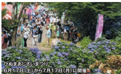
ひぬまあじさいまつり 6月17日(土)から7月17日(月)に開催