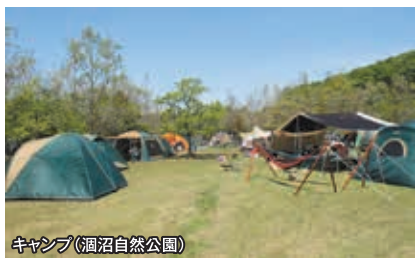
キャンプ(涸沼自然公園)